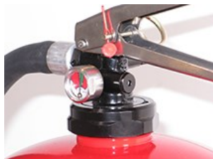
Släckarna har ett robust handtag och en kraftig avtryckare för öppning och stängning av ventilen

Dafo skumsläckare är fyllda med filmbildande skum. Släckmedlet släcker och kyler det brinnande ämnet och ligger sedan kvar som skydd mot återantändning.