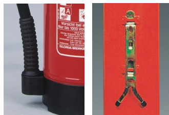
Plastfot med slangfäste

Vägghängare medföljer. Fordons- och fartygsstativ samt olika typer av skyddsskåp finns som tillbehör.